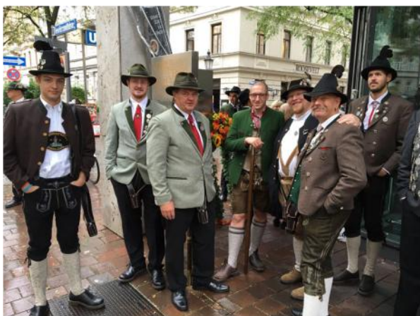
Fahnen- und Standartenträger im Oktoberfestumzug, für diese Männer eine Ehre.