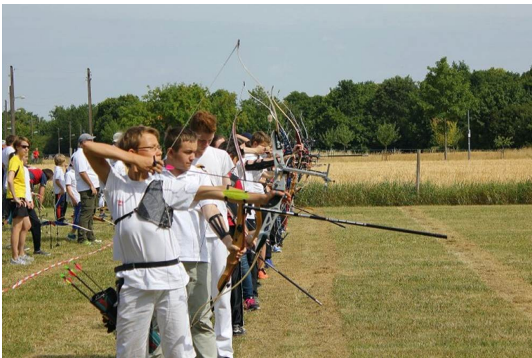
50 Bogenschützen im Alter von zehn bis sechzehn Jahren trugen das Aligo Open 2014 in Pasing aus.

ALIGO-Open 2014 auf dem Bogengelände der Pasinger SG Grabenfleck